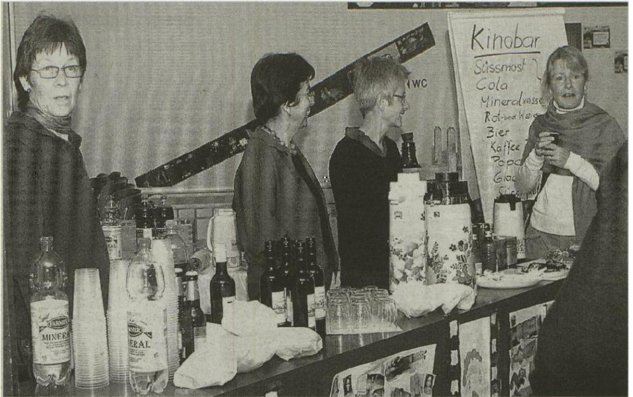
Auch die Kinobar darf nicht fehlen.