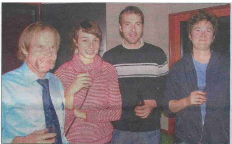
L'équipe de Road-movie en compagnie du syndic de Gollion.

N° de thème: 832.30 N° d'abonnement: 1089563 Page: 13 Surface: 44'154 mm 2