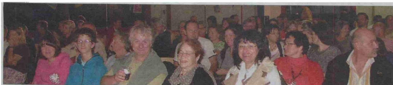
La bonne humeur et une certaine excitation règnent dans la salle à l'approche de la séance de cinéma.