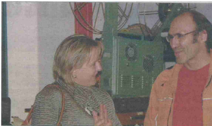
L'acteur Antonio Buil a su charmer ces dames...

Une soirée réussie, un concept séduisant, un très chouette souvenir pour tous ceux qui y étaient. On peut remercier la commune de Gollion d'être toujours partante pour de nouvelles aventures.